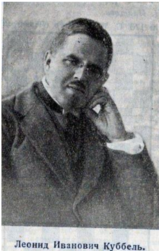
Леонид Иванович Куббель.

А это фото Леонида Ивановича появилось на страницах журнала Н.Грекова «Шахматы» в 1925-м в связи с выходом в свет его первой книги - «150 шахматных этюдов», с глубоким почтением отрецензированной еще одним классиком отечественного этюда - Василием Николаевичем Платовым. Объявившем: «Выход в свет сборника этюдов Леонида Куббеля является праздником не только русского этюдного искусства, но большим событием также и в европейском масштабе».