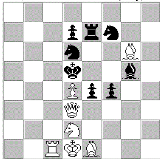
Диаграмма № 3 И.С.Шумов, 1867г. (Посвящается А.Петрову)

1.a6 Sf6 2.a:b Se4 3.b:aП! Kf1=пат! Очень оригинальная трактовка правил! И наконец позиция Шумова: