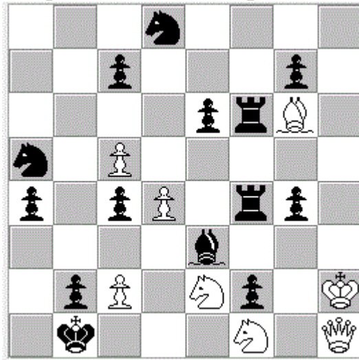
Диаграмма № 1 А.Петров, 1824 г.

1.Sd2+ Ka2 2.Sc3+ Ka3 3.Sdb1+ Kb4 4.Sa2+ Kb5 5.Sbc3+ Ka6 6.Sb4+ Ka7 7.Sb5+ Kb8 8.Sa6+ Kc8 9.Sa7+ Kd7 10.Sb8+ Ke7 11.Sc8+ Kf8 12.Sd7+ Kg8 13.Se7+ Kh8 14.Kg2#.