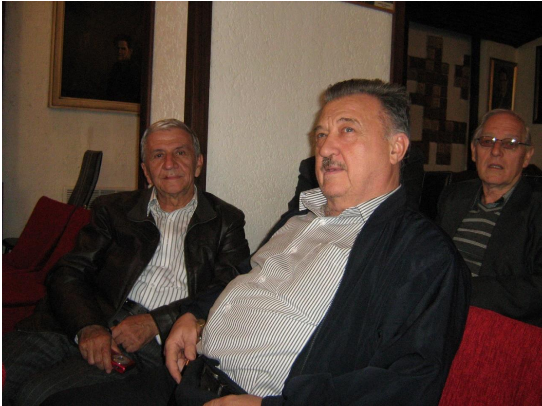
Left: Milošeski B. H-Vaskov G. Mihajloski Z. (2012)