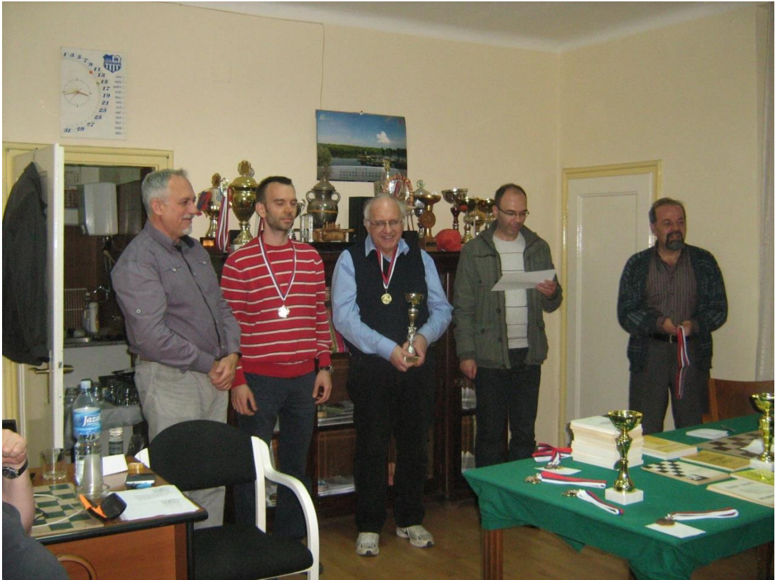
(BiT, Belgrade, 2014)