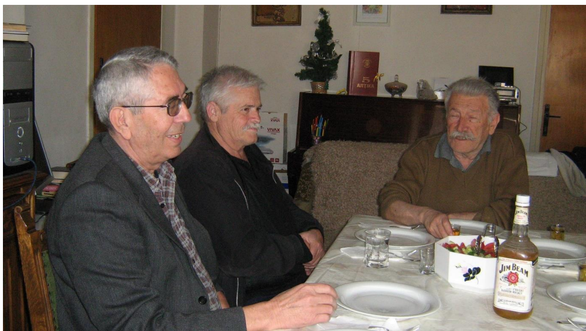
Left: Denkovski G. Stojoski P. Popovski A. (2011)