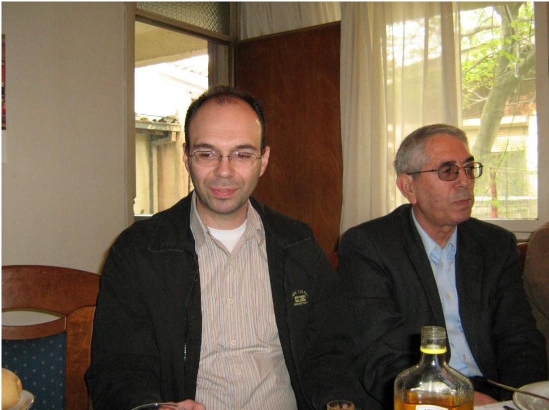
Left: Denkovski I. Denkovski G. (2010)