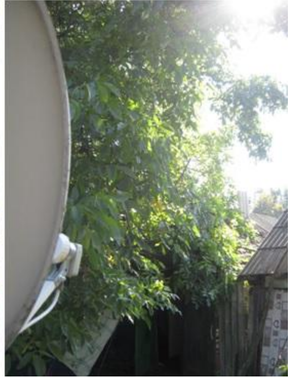
Фото до и после обрезания. Но, видимо, придётся ещё обрезать...

1-10 октября 2021 Григорий Попов PopovGL@yandex.ru