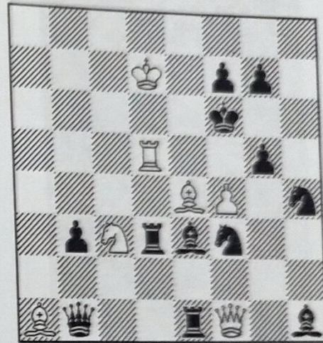
76. Александър Шмалко Тематичен конкурс 1947 1-ва премия

75. 1.♞e3! (2.♞e4#) 1...♞e8 2.♙e5#, 1...♞d8 2.♙d6#, 1...♞c8 2.♙c7#, 1...♞b8 2.♙:b8#, 1...♞:f4+ 2.♞:f4#