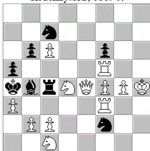
Диаграмма № 4 И.С.Шумов, 1869 г.

Но тема не исчерпывается и этим. Известна и другая композиция Шумова, изображающая якорь -